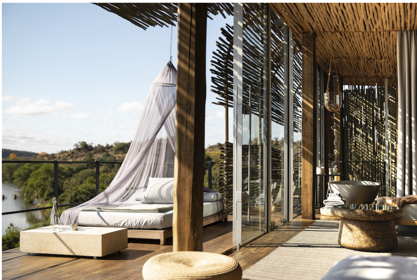
Singita, Lebombo, Kruger National Park, South Africa